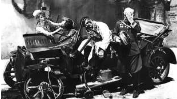
Убийство Франца Фердинанда в Сараево

Поводом к началу Первой мировой войны послужили события в Сараево (Босния и Герцеговина). 28 июня 1914 года член организации «Черная рука» движения «Молодая Босния» Гаврило Принцип убил эрцгерцога Франца Фердинанда. Фердинанд был наследником австро-венгерского престола, поэтому резонанс у убийства был громадный. Это был повод Австро-Венгрии напасть на Сербию.