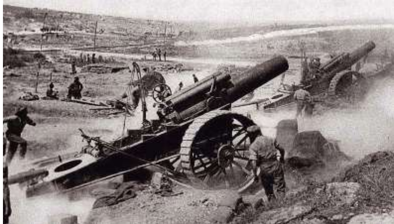
Тяжелая артиллерия времен первой мировой

Еще один пример, показывающий значимость артиллерии, это бои на линии Дунаец Горлице (май 1915). За 4 часа армия Германии выпустила 700 000 снарядов. Для сравнения, за всю франко-прусскую войну (1870-71) Германия выпустила чуть более 800 000 снарядов. То есть за 4 часа немного меньше, чем за всю войну. Немцы четко понимали, что решающую роль в войне сыграет тяжелая артиллерия.